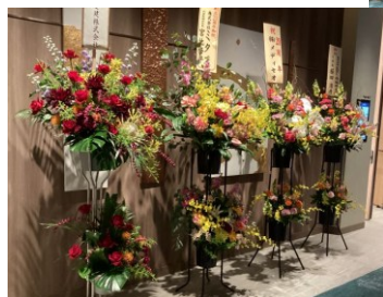
◀お祝いのお花も たくさんいただきました。